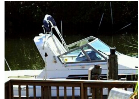
Schutz von "Hab und Gut"